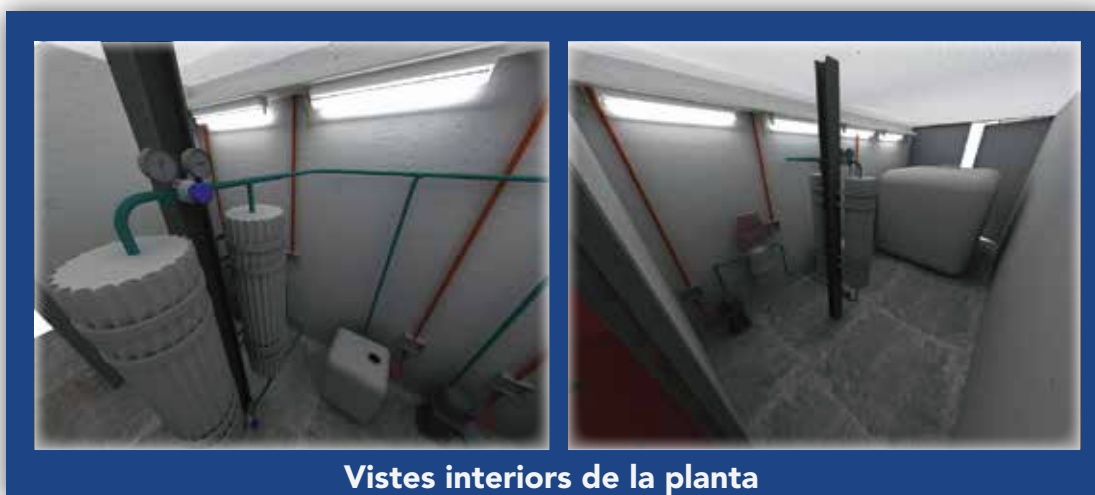
Vistes interiors de la planta