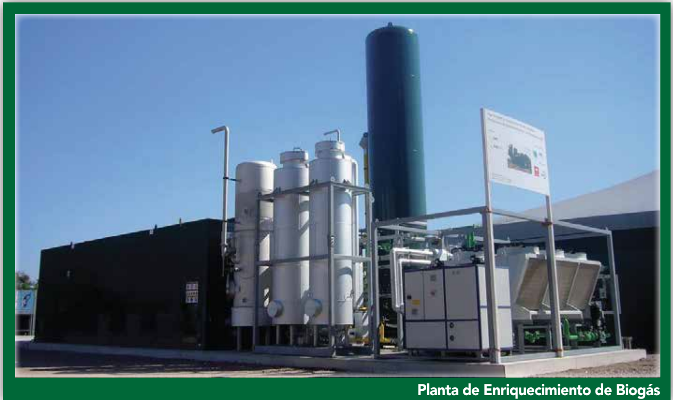
Planta de Enriquecimiento de Biogás

Dim Water Solutions suministra una tecnología especial que permite la purificación del biogás para transformarlo en biometano. El gas biometano es una atractiva alternativa a los combustibles fósiles. Se puede mezclar con el gas natural y se inyecta directamente a los gasoductos convencionales. O utilizarlo como biocombustible para medios de transporte.