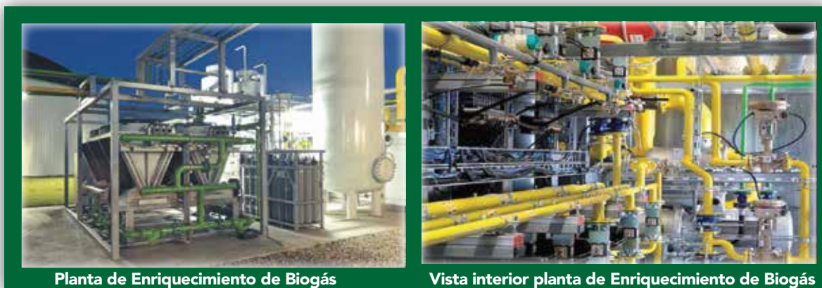
Planta de Enriquecimiento de Biogás

La integración de esta tecnología aumenta el rendimiento de gas metano y mejora la eficiencia global de la planta de enriquecimiento por lo que se obtiene biometano con calidad para automoción y/o inyección a la red de gas natural.